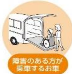
障害のある方が乗車するお車

障害のある方が乗車するお車だけではなく、ご家族のお車にもこの割引を適用することができます。