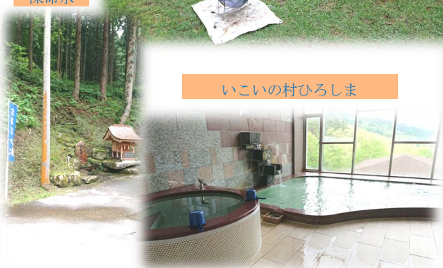
いこいの村ひろしま