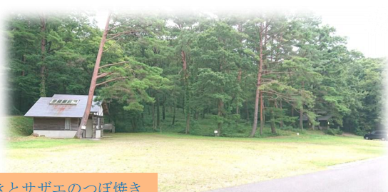
カツオのたたきとサザエのつぼ焼き